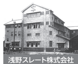
浅野スレート株式会社